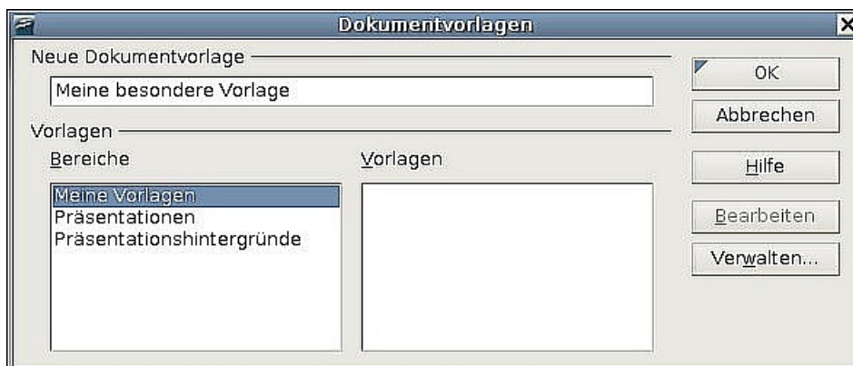
Abbildung 2: Eine neue Dokumentvorlage speichern