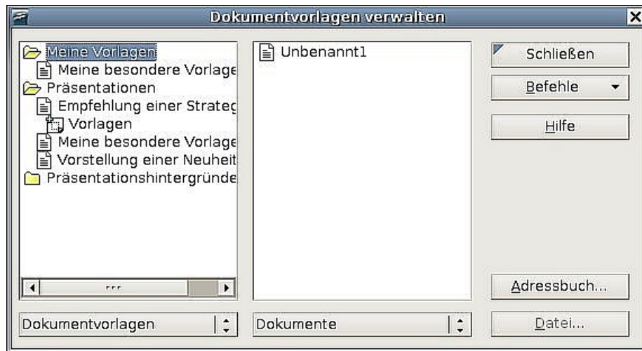
Abbildung 3: Das Fenster "Dokumentvorlagen verwalten"